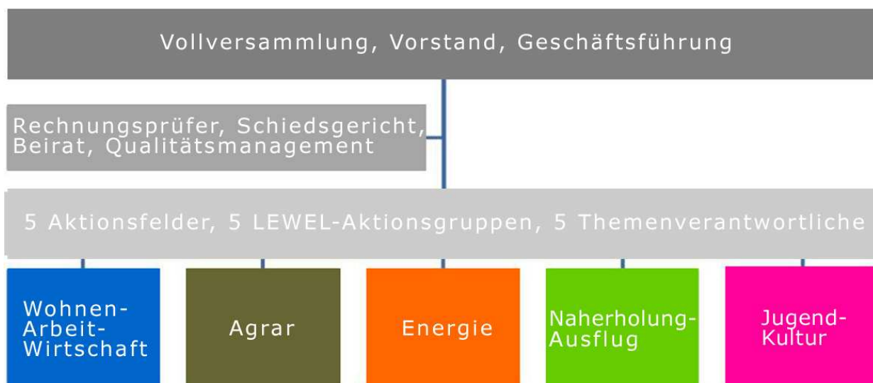
Abb.: Organigramm Regionalentwicklungsverein Leaderregion Wels-Land – LEWEL

Alle 21 Mitgliedsgemeinden sind in den Vereinsgremien vertreten und an der erfolgreichen Umsetzung der regionalen Entwicklungsziele unmittelbar beteiligt!